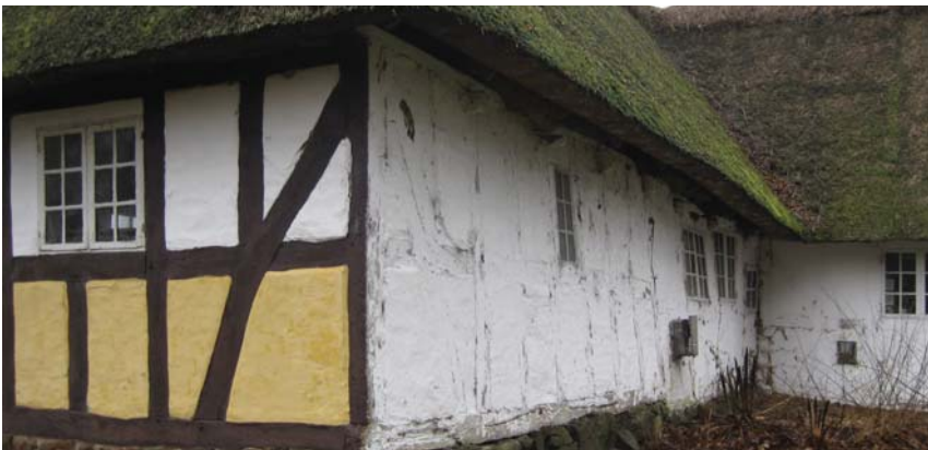
Udlængen, hvidkalket bagside