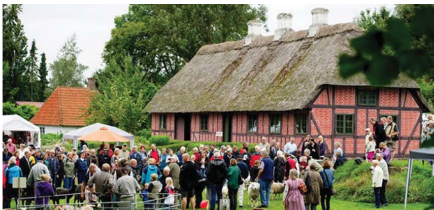
Urmagerhuset, Afvikling af årets fåredag 2011