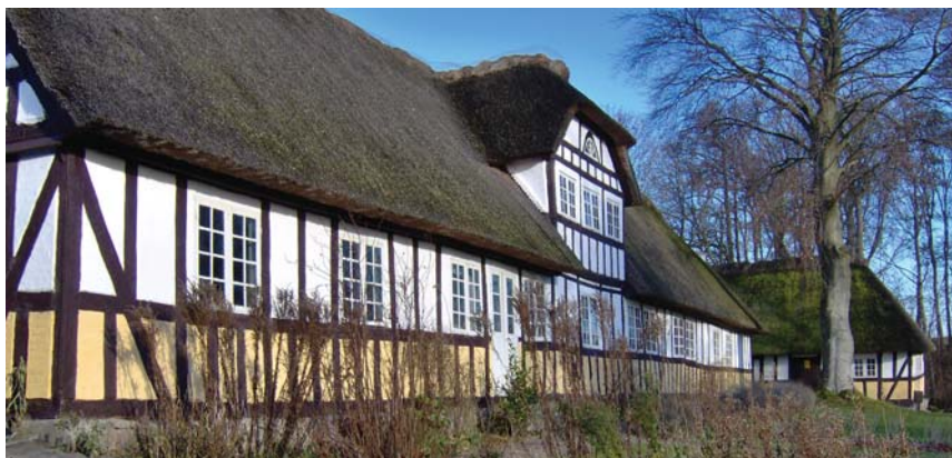
Hjemstavnsgården, Landmålergården fra havesiden