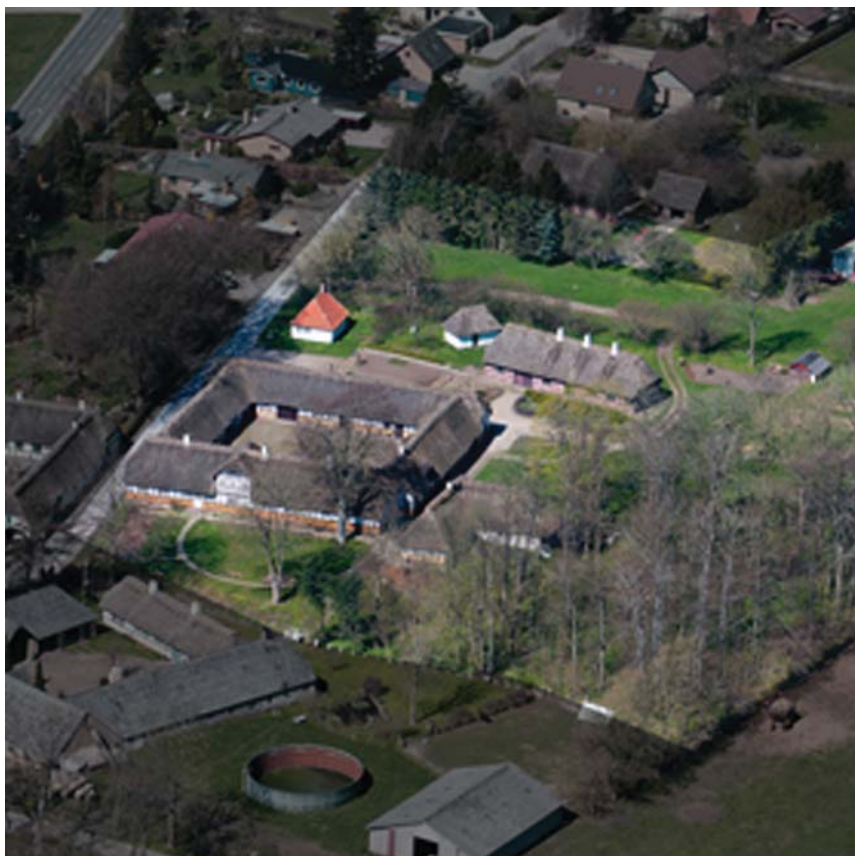
Landmålergården og udbygninger.