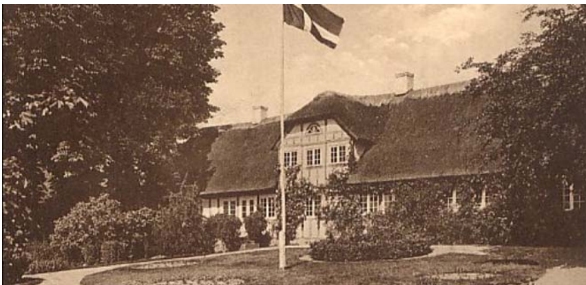
Vestfyns Hjemstavnsgård 1931

SMEDJEN og TØRVEKOVEN er vigtige bygninger for fortællingen om smedefaget. De små erhvervsbygninger, der mange steder er gået tabt, er her bevaret og har tydeligvis været i gode hænder, der har sørget for at bevare de håndværksmæssige fine detaljer og materialer. Således er tagene lagt på håndhuggede finske lægter, glug- og udluftningshuller er bevaret og der er anvendt korrekte mørtler og udlusningsmetoder.